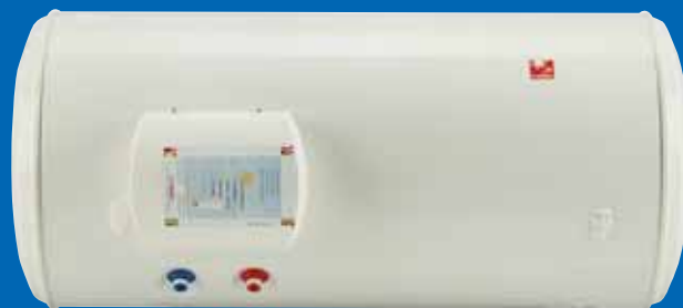
Modèle Horizontal Mural