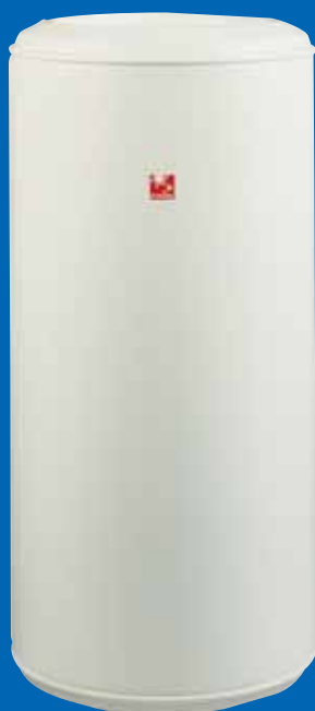
Modèle Vertical Mural