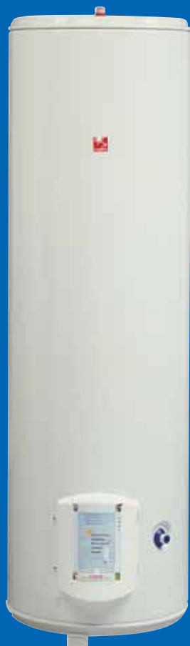
Modèle Vertical sur Socle