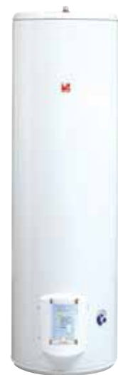
Vertical sur Socle